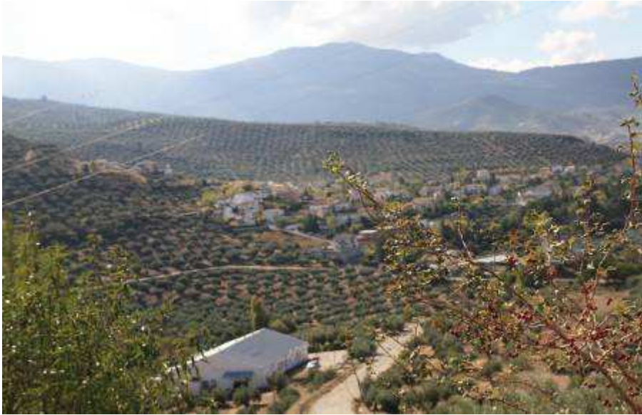
Vista panorámica de Los Villares, con la Sierra de la Pandera al fondo