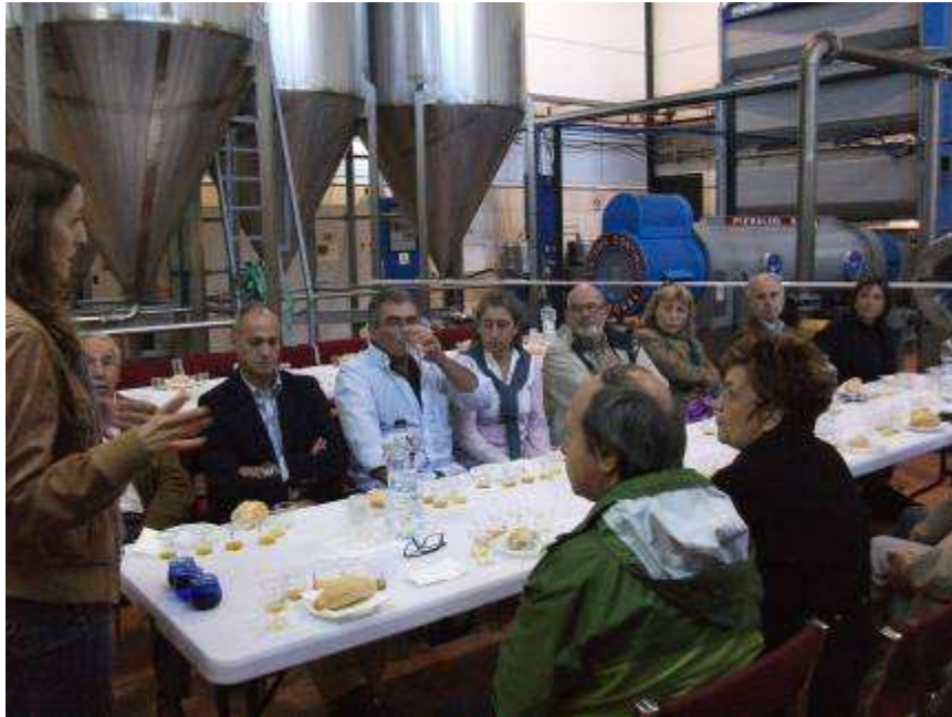
Cata de aceites, con la amable responsable de Calidad de la Almazara Jiménez, patrocinadora del Congreso.

En este momento un grupo de congresistas se despiden aquí, pues les espera un largo viaje hacia tierras valencianas y catalanas, mientras el resto suben en coche hasta la cima de la Pandera una imponente serranía de casi dos mil metros de altura, muy conocida en España en los últimos tiempos pues no en vano ha sido meta de llegada de varias etapas de la Vuelta Ciclista a España. Los congresistas admiran sus rampas de inusitada pendiente y las vistas que se van observando a medida que culmina el ascenso. Una vez arriba, espera un Km. de paseo hasta llegar a la casa de los vigilantes de incendios donde todos admiran el pantano de Quiebrajano que yace